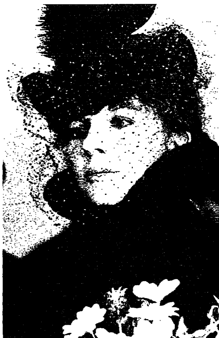
ديان كيتون - سيات الذي المترق للخلود الى الحرية